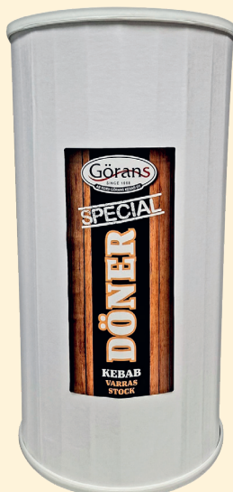
Art nr 818352/8352 Görans Special Döner kebabspett, 15kg

Special Döner kebabspett med 76% köttthalt. Unik förpackning som garanterar pinnen mitt i spettet. Frost, 365 dagars hållbarhet.